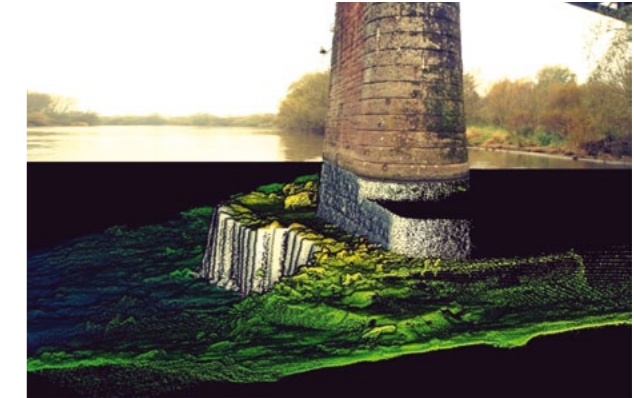
Рис. 2. Визуализированное изображение опоры моста по результатам обследования VRT

Разработанный VRT метод обследования на практике пока применяется чаще всего для обследования подводных частей причальных сооружений портов. Наряду с портовыми сооружениями объектами исследования также являются подводные конструкции волнорезов, плотин, зданий гидроэлектростанций, конструкции опор мостов через реки, каналы и проливы, опор средств навигационного оборудования, таких