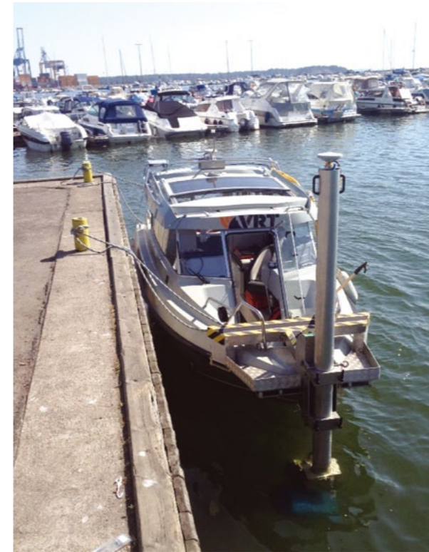
Рис. 1. Гидрографическое судно VRT

Примером может служить одновременное использование двух систем спутникового позиционирования (GPS+ГЛОНАСС), которое гарантирует хорошую доступность